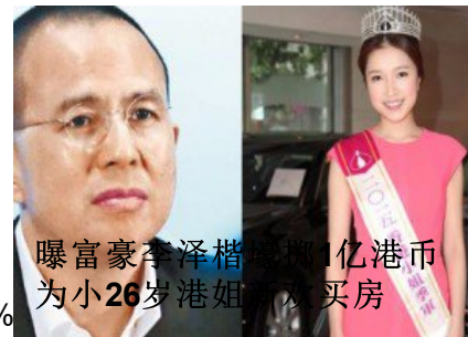
曝富豪李泽楷 10亿港币 为小26岁港姐 买房

(http://www.enanyang.my/news/20170329/%e9%87%8c%e8%9b%af%e8%97%e8%ad%e8%9e%20%160924/%e8%8d%e8%e6%96%b0%e5%a2%9e%e5%90%88%e7%ba%a6%e6