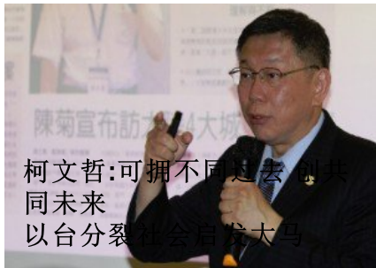
柯文哲:可拥不同过去 同未来 以台分裂 台岛为大