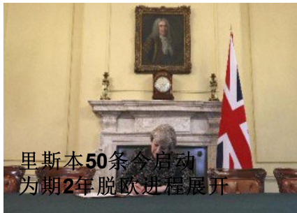
里斯本50条今启动 为期2年脱欧进程展开

(http://www.enanyang.my/news/20170329/%e9%87%8c%e8%9b%af%e8%97%e8%ad%e8%9e%20%160924/%e8%8d%e8%e6%96%b0%e5%a2%9e%e5%90%88%e7%ba%a6%e6