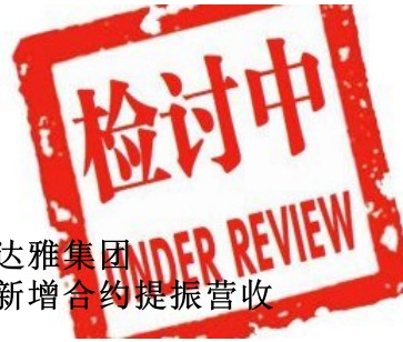
达雅集团 新增合约提振营收

(吉隆坡3日讯) 达雅集团 (DAYA, 0091, 主板贸服股) 签署了解备忘录, 开发交通领域设立人群/乘客系统解决方案。达雅集